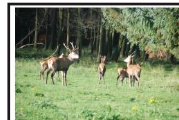
Idyl i Bangsboskoven.

På bagsiden kan du se hvordan du let finder Bangsbostrand Skole. Læs mere om vandrebuketten på: www.nordiskvandrebuket.dk