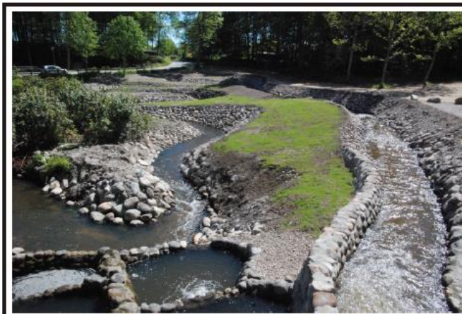
Fisketrappe ved Møllehuset